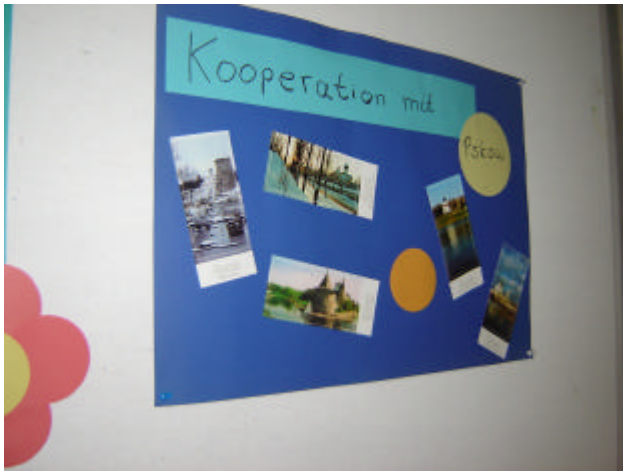
Vorbereitung des Treffens durch Schülerplakate zur Stadt Pskov

Eschweilers dar. Der Tag endet für die Schüler in den Gastfamilien und für die Lehrer im Restaurant und in den Familien der deutschen Kollegen, sodass den russischen Gästen in ausreichender Form Gelegenheit zu einem Einblick in den deutschen Alltag und in deutsche Lebens- und Essgewohnheiten gegeben wird.