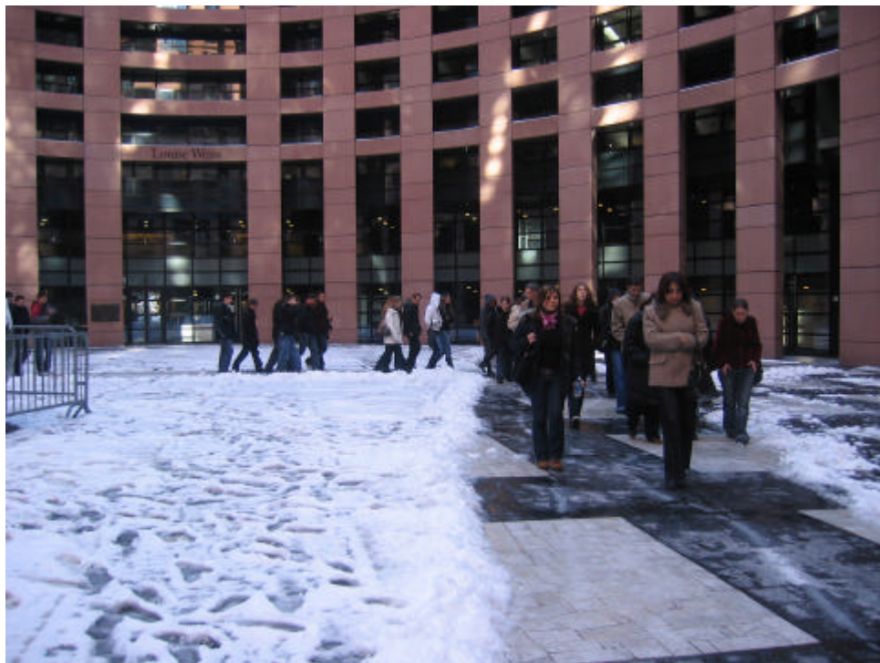
Der Innenhof des Europaparlaments im Schnee