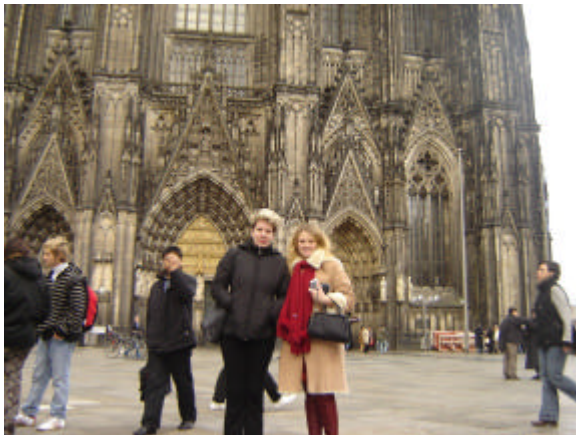
Eindrucksvoll: Der Dom

Nicht mehr viel Zeit bleibt danach für einen Stadtbummel, denn die russischen Gäste möchten noch Souvenirs für zu Hause kaufen, ehe wir (und dieses Mal hat der Zug mehr als 30 Minuten Verspätung) wieder mit dem Zug nach Eschweiler fahren. Der Abend klingt beim Essen in den Gastfamilien aus und die deutschen Schüler zeigen ihren russischen Gästen das berühmte "Eschweiler Nachtleben".